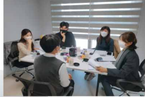
▲ 입주자 선정심의위원회