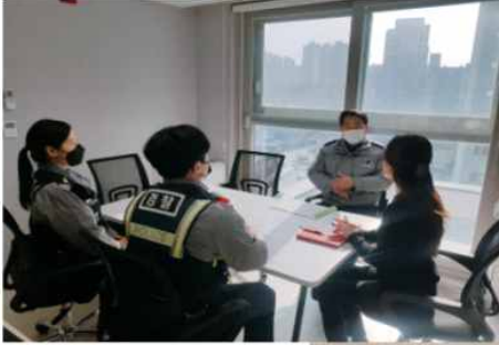
▲ 지역자원 연계협력 네트워크