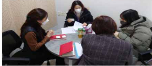
▲ 관계자 간담회